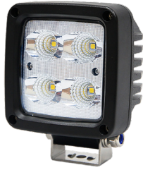
QWL40 / QWL40-DT