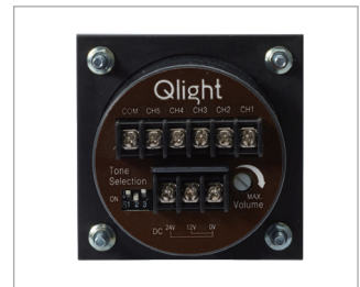
전원 및 음색 결선용 단자대(후면)

※ 내장음 최대 음량은 WS-Ch1 / WM-Ch4 / WA-Ch4 기준입니다.