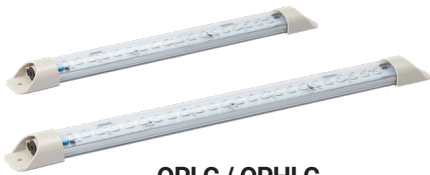
QPLC / QPHLC 투명 렌즈