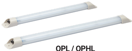
QPL / QPHL 반투명 렌즈