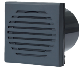
SPK I SPK-N