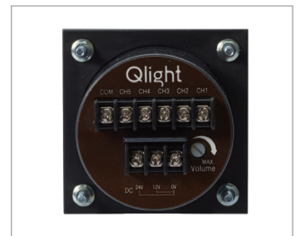
전원 결선용 단자대(SPK-N 후면)