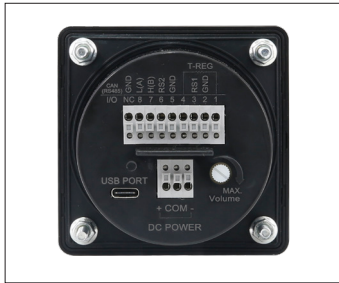
전원 및 RS485통신케이블 연결 단자대(후면)

※ MP3 파일 재생 시 고객이 사용하는 음원의 종류에 따라 음량 편차가 발생할 수 있습니다.