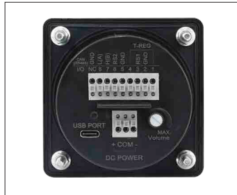
전원 및 CAN 통신케이블 연결 단자대(후면)