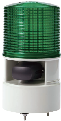
S125DL / S125DS