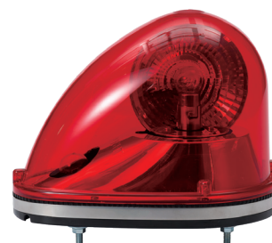
SK / SKH