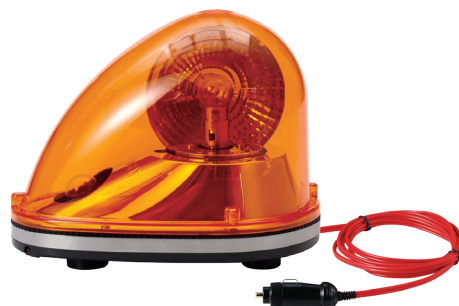
SKM / SKMH