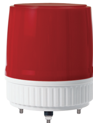
S180US / S180UHS