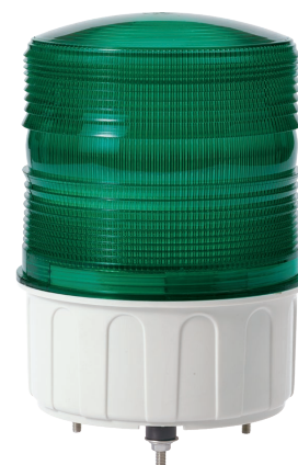
S150UL / S150US