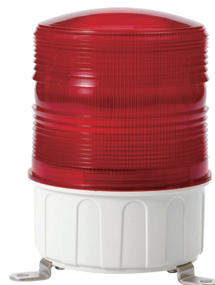
S150UL-FT / S150US-FT