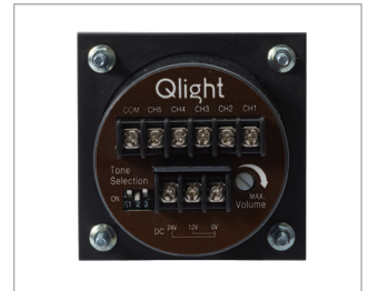
電源および音色結線用端子台 (SPK背面)