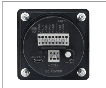
電源又はCAN通信ケーブル接続端子台(背面)

※ MP3ファイルの再生する時、お客様が使用する音源の種類によって音量偏差が発生することがあります。