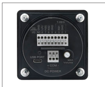
電源又はCAN通信ケーブル接続端子台(背面)

※ MP3ファイルの再生する時、お客様が使用する音源の種類によって音量偏差が発生することがあります。