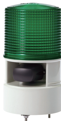
S125DL / S125DS