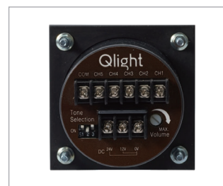
電源および音色結線用端子台(背面)

※ 内蔵音の最大音量はWS、WP-Ch1 / WS-Ch4 / WA-Ch4基準です。